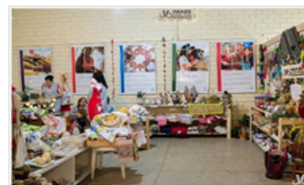
Foto: Participação de IMABE em la Expo FEMI 2018, en Xanxerê – Santa Catarina – Brasil

Apesar do pouco tempo de entidade, o Instituto já está conquistando seu espaço e desenvolvendo uma nova forma de fazer gestão dos projetos sociais, buscando qualificação e inovação para enfrentar os problemas sociais de um mundo cada vez mais excludente de direitos e de cidadania.