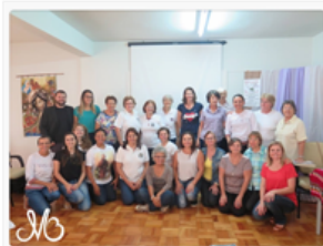
Foto: Fundação do Instituto Madre Bernarda – IMABE em abril de 2017, em Chapecó

Os projetos executados e apoiados pelo IMABE têm como público alvo crianças, adolescentes, jovens, adultos e idosos em situação de vulnerabilidade social. Ainda, grupos específicos compõem os atendidos, como indígenas, movimentos sociais, imigrantes e catadores de materiais recicláveis.